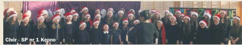
Chór - SP nr 1 Kępno