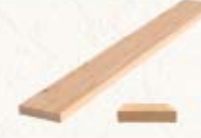
Deska tarasowa ryflowana