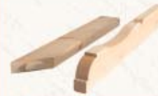
Więźba dachowa obrabiana na CNC