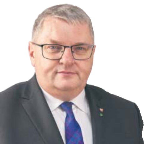
Krzysztof Grabowski - Wicemarszałek Województwa Wielkopolskiego

Celem programu pn. „Deszczówka” jest przeciwdziałanie skutkom suszy w wielkopolskich gminach i powiatach, spowodowanych niską sumą opadów atmosferycznych, jak również wydłużaniem się okresów bez opadów w czasie wegetacji roślin. Działania realizowane w ramach programu przyczyniają się do wymiernych oszczędności przy nawadnianiu terenów zielonych, poprawy jakości wód opadowych, poprzez jej infiltrację i naturalne oczyszczanie, jak również do odciążenia systemów kanalizacji deszczowej, co ma szczególne znaczenie przy coraz częściej występujących deszczach