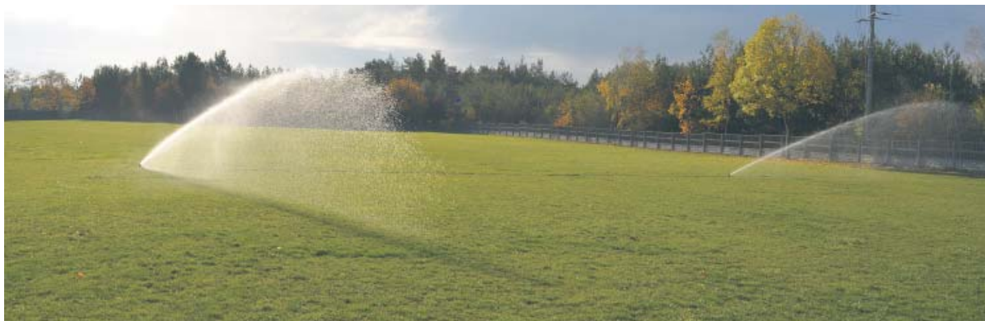
Gmina Brudzew – „Budowa systemu podziemnego magazynowania wody opadowej na potrzeby instalacji nawadniającej płytę boiska przy Szkole Podstawowej w Galewie” – 2023 r.

nawalnych, skutkujących lokalnymi podtopieniami.