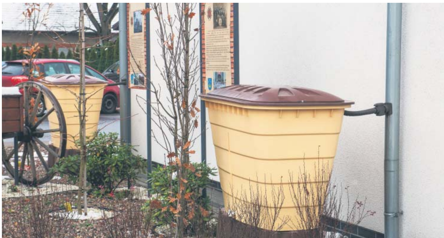
Godziesze Wielkie – „Wykorzystanie wody opadowej w celu nawadniania zieleni przy Budynku Tradycji w Godzieszach Wielkich, ul. 11 Listopada nr 1” – 2020 r.