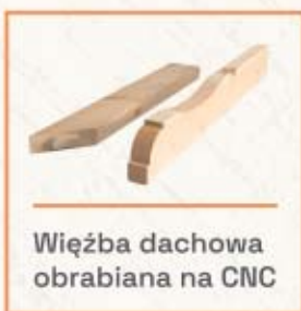
Więźba dachowa obrabiana na CNC