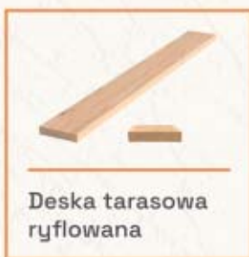
Deska tarasowa ryflowana