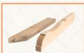
Więźba dachowa obrabiana na CNC