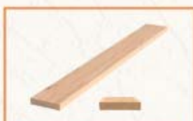
Deska tarasowa ryflowana