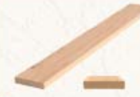
Deska tarasowa ryflowana