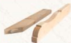
Więźba dachowa obrabiana na CNC