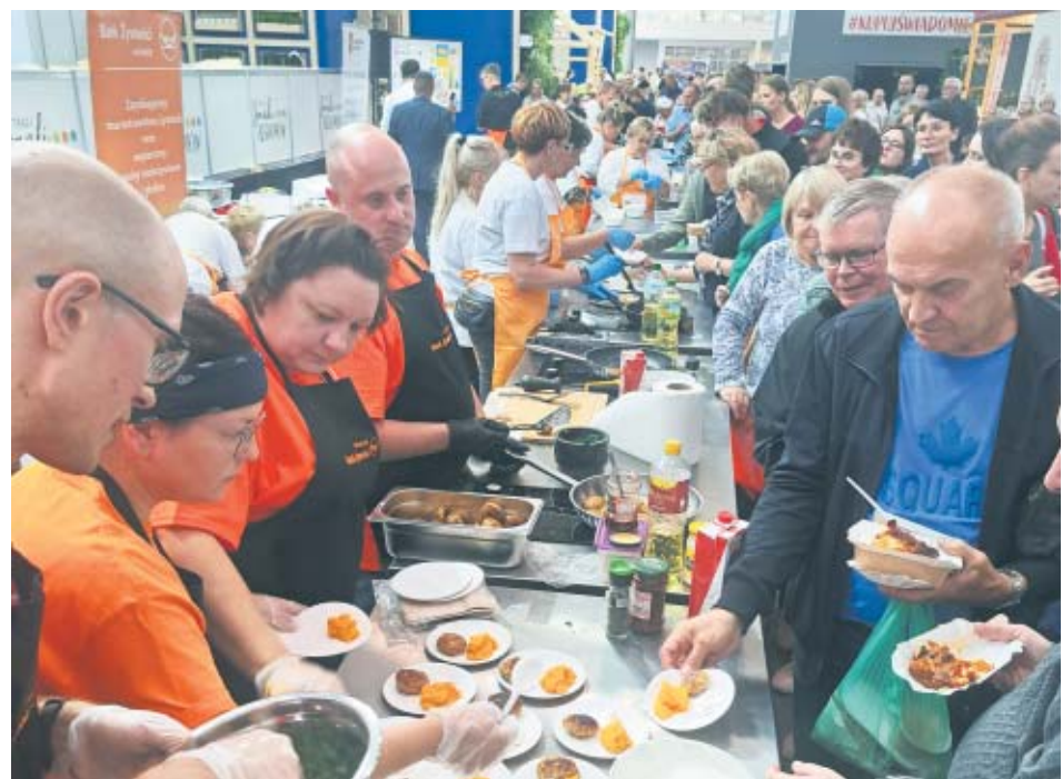
Pokazy kulinarne przygotowywane przez banki żywności zawsze cieszą się dużym zainteresowaniem wśród publiczności. To potwierdzenie tego, że „zero waste” smaczne jest.