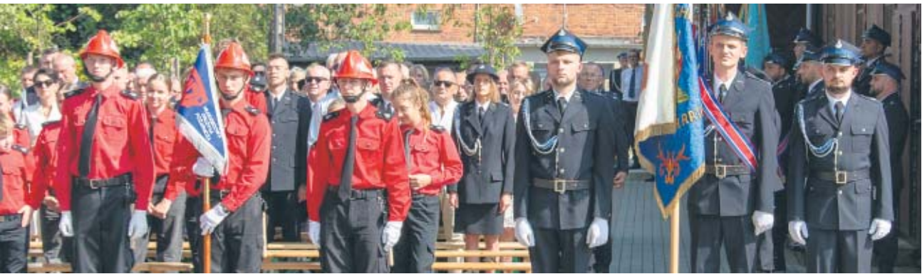
Jubileusz 90-lecia istnienia świętowała Ochotnicza Straż Pożarna w Olszowie