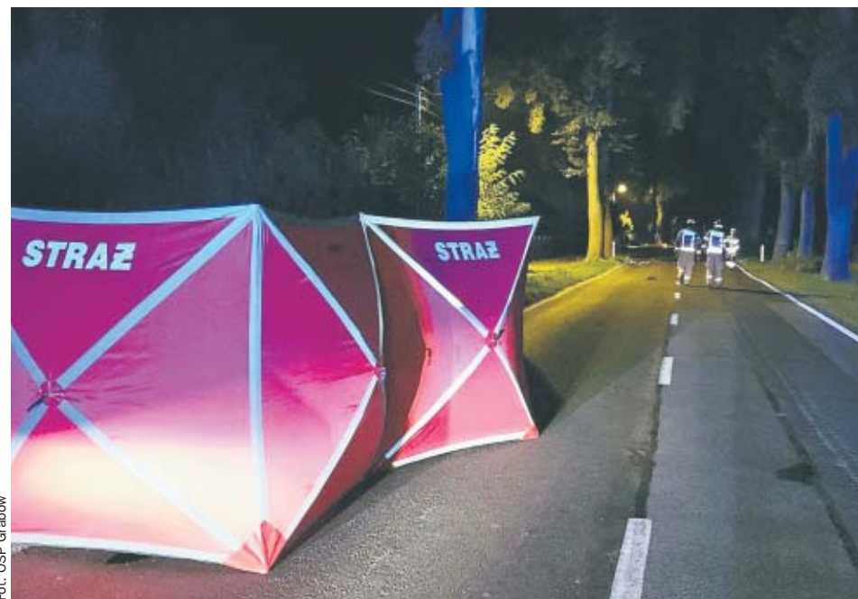
Fot. OSP Grabów

- Ze wstępnych ustaleń wynika, że w miejscowości Grabów Wójtostwo, na oświetlonym, prostym odcinku drogi wojewódzkiej W450 w terenie zabudowanym, gdzie obowiązuje ograniczenie prędkości do 70 km/h, kierujący audi 24-letni mieszkaniec gminy Grabów w stanie nietrzeź-