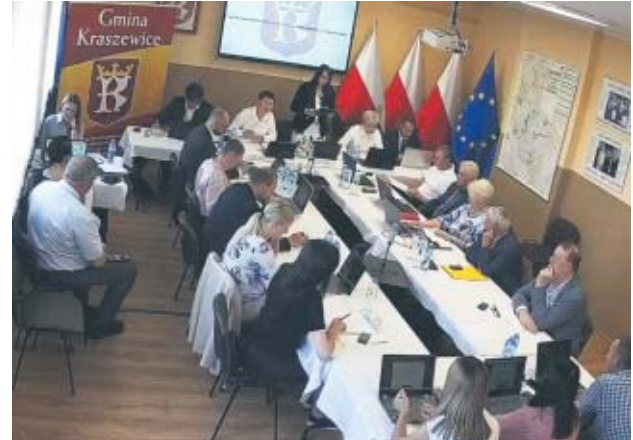
KRASZEWICE Podczas sesji przedsiębiorca w niewybredny sposób zaatakował radną