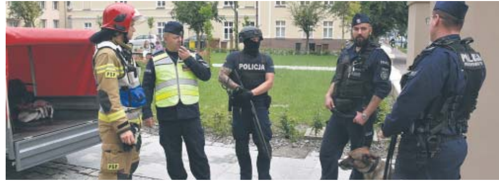
pińscy policjanci oraz inne służby. O godzinie 13.30 dyżurny Komendy Powiatowej Policji w Kępnie otrzymał zgłoszenie, że w budynku Starostwa jest pożar oraz mogą znajdować się tam materiały wybuchowe. Policjanci

W dniach 4-5 czerwca w Starostwie Powiatowym w Kępnie odbyło szkolenie oraz ćwiczenia doskonalące dla pracowników realizujących działania obronne w urzędach miast i gmin powiatu kępińskiego. W działaniach wzięli również kę-