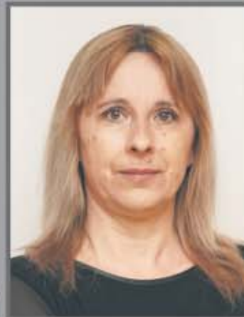
Okręg nr 12 Jelenie nr 2