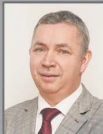
Okręg nr 5 Kraszewice nr 1 (Kaliska, Głuszyńska, Połna, Leśna, Wenecka)