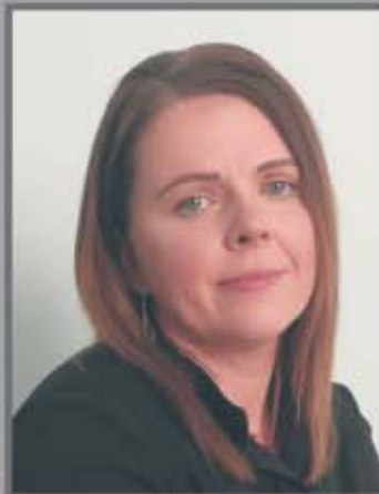
Okręg nr 11 Jelenie nr 1 (Jelenie, Jeziorki)