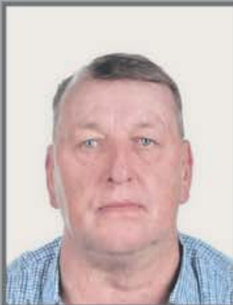
Okręg nr 9 Kraszewice nr 3 (Kwiatowa, Grabowska, Wieruszowska)