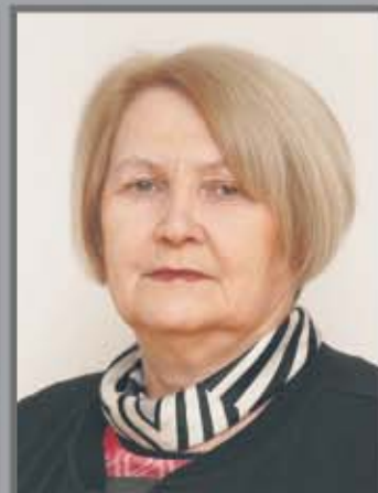
Okręg nr 6 Kraszewice nr 1 (Wieluńska, Wieruszowska, Ks. Strugały, Plac Wolności, Szkolna)