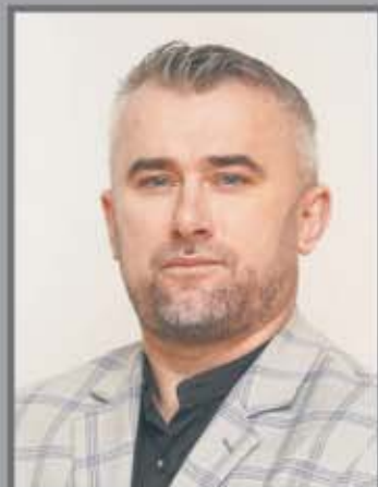
Okręg nr 2 Racławice