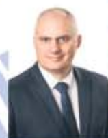
3. Konrad Kuświk Wójt Gminy Kraszewice