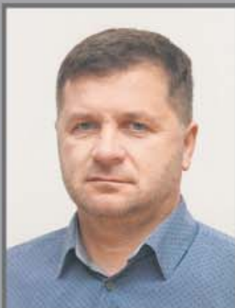
Okręg nr 3 Jaźwiny