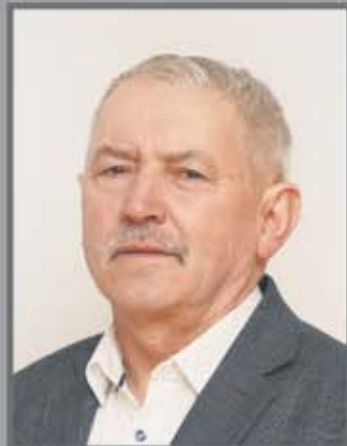
Okręg nr 7 Kraszewice nr 2 (Leśna, Młyńska, Wieluńska, Zielona, Młodych Pokoleń)