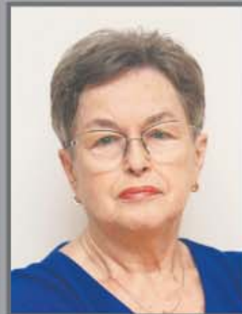
Okręg nr 13 Kuźnica Grabowska nr 3-67