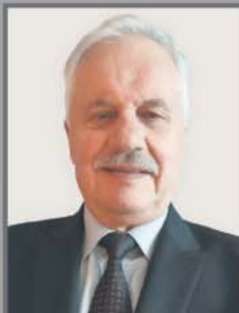
Okręg nr 4 Kraszewice nr 1 (Mickiewicza, Sienkiewicza, Słowackiego, Ciasna, Grabowska)