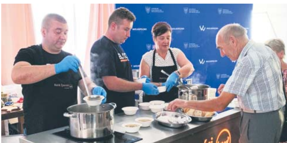
Punktem kulminacyjnym spotkania z członkami Stowarzyszenia „Trzecia Zmiana” w Kole był pokaz kulinarny, pt. „Jak przyrządzić flaczki z boczniaków?” oraz wykład dotyczący niemarnowania żywności zaprezentowany przez pracowników Banku Żywności w Koninie. Wydarzenie zostało sfinansowane przez Samorząd Województwa Wielkopolskiego.