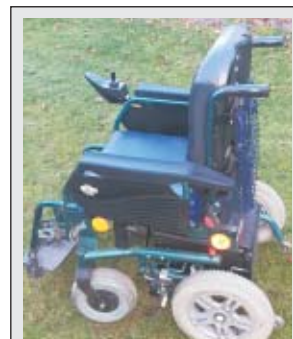
Sprzedam wózek inwalidzki elektryczny. Tel. 518 418 113