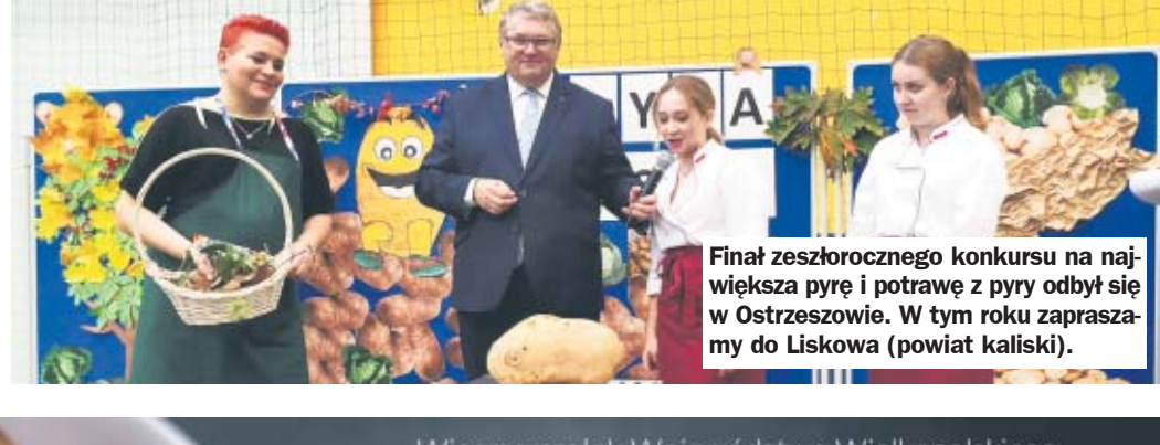
Finał zeszłorocznego konkursu na największą pyrę i potrawę z pyry odbył się w Ostrzeszowie. W tym roku zapraszamy do Liskowa (powiat kaliski).

Wykopałeś gigantyczną pyrę? Znasz przepis na pyszne danie z pyry? Mamy dla Ciebie konkurs z nagrodami!