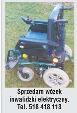
Sprzedam wózek inwalidzki elektryczny. Tel. 518 418 113

SPRZEDAM Wersalkę rozkładaną, beżowo-brązową, cena 400 zł. Tel. 691 327 170 Ładę sklepową, biała, szklana, cena 500 zł., lada chłodnicza 2 m dł., cena 1500 zł. Tel. 728 982 153 Narożnik. Tel. 669 0469 095 Wyrzynarkę brzeszczotową. Tel. 669 469 095