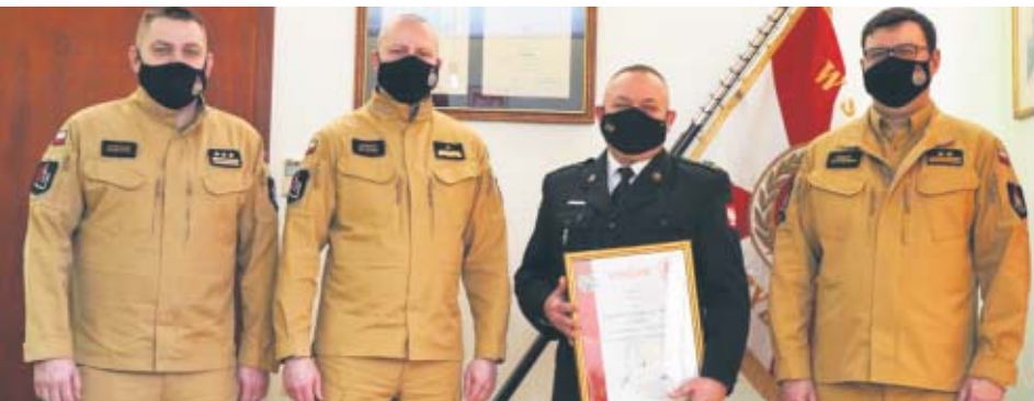
Komenda Powiatowa Państwowej Straży Pożarnej w Kępnie zajęła pierwsze miejsce w rankingu komend PSP województwa wielkopolskiego za 2021 rok.

2 marca odbyła się roczna narada podsumowująca pracę Komendy Wojewódzkiej PSP w Poznaniu w roku 2021, podczas której wielko-