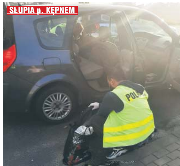
zastosował wobec mężczyzny środek zapobiegawczy

Mężczyzna został zatrzymany i osadzony w pomieszczeniu dla osób zatrzymanych. Prokurator