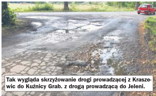
Tak wygląda skrzyżowanie drogi prowadzącej z Kraszewic do Kuźnicy Grab. z drogą prowadzącą do Jeleni.