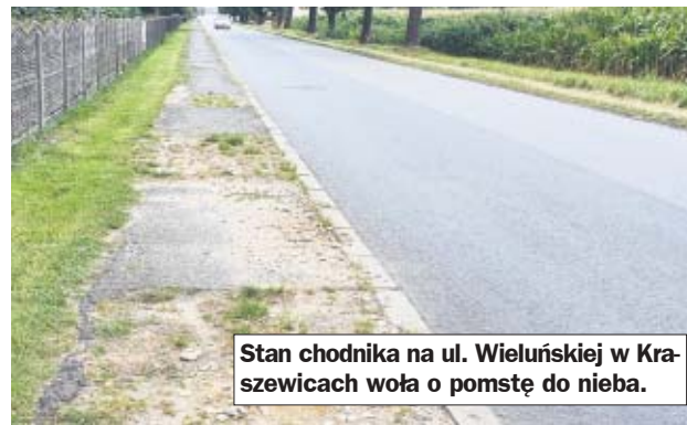
Stan chodnika na ul. Wieluńskiej w Kraszewicach woła o pomstę do nieba.

- Nie ma środków, nie ma nawet żadnych deklaracji ze strony Powiatu - żali się wójt Kraszewic. - My oczekujemy, że droga przez centrum Kraszewic, która również jest w bardzo złym stanie, też będzie przebudowana, natomiast to jest tak odległa sprawa, że nawet trudno to sobie wyobrazić czy marzy o tym remoncie. Teraz czekamy na remont w Kuźnicy Grabowskiej - dodaje.