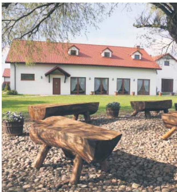
Osada Babia Góra – laureat konkursu

uatrakcyjnianie oferty, dbanie, by się rzecz rozwijała z duchem czasów i spełniała oczekiwania gości”. I dodaje: „W wielu miejscach widać ten twórczy wysiłek, pasję stworzenia czegoś przyjaznego i funkcjonalnego. Pozostają pod wrażeniem, jakie cuda udaje się wykreślać z niektórych wielkopolskich siedlisk.”