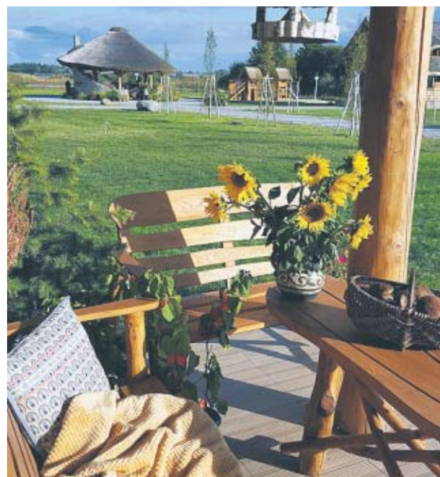
Osada nad Gopłem - laureat konkursu

Zjawisko boomu agroturystycznego jest dostrzegalne „gołym okiem” - zmiany w krajobrazie postępują w imponującym tempie. Z pozytywnymi zaskakującymi efektami. To, co niedługo było szare, bądź niszczało i chyliło się ku upadkowi, jest podnoszone, restaurowane, świeci dawnym blaskiem i znajduje nowe pożyteczne przeznaczenie. W wielu, wydawałoby się zapomnianych miejscach - folwarkach, wiatrakach, kuźniach, spichlerzach, stodołach, warzelniach, ale też w odnowionych starych chatkach, młynach, urokliwych rodzinnych wiejskich posiadłościach i pieczeniowiczych zrekonstruowanych pałacach czy ziemiankich dworach powstają miejsca noclegowe z doskonale zaprojektowanymi przestrzeniami do wypoczynku, zabawy i aktywności. Podejmowane starania w zarządzanych obiektach zyskują pozytywną ocenę. Odwiedzający czują się tam „lepiej niż w domu”,