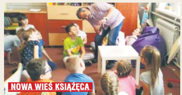
NOWA WIEŚ KSIĄŻĘCA

W czasie ferii nauczyciele edukacji wczesnoszkolnej