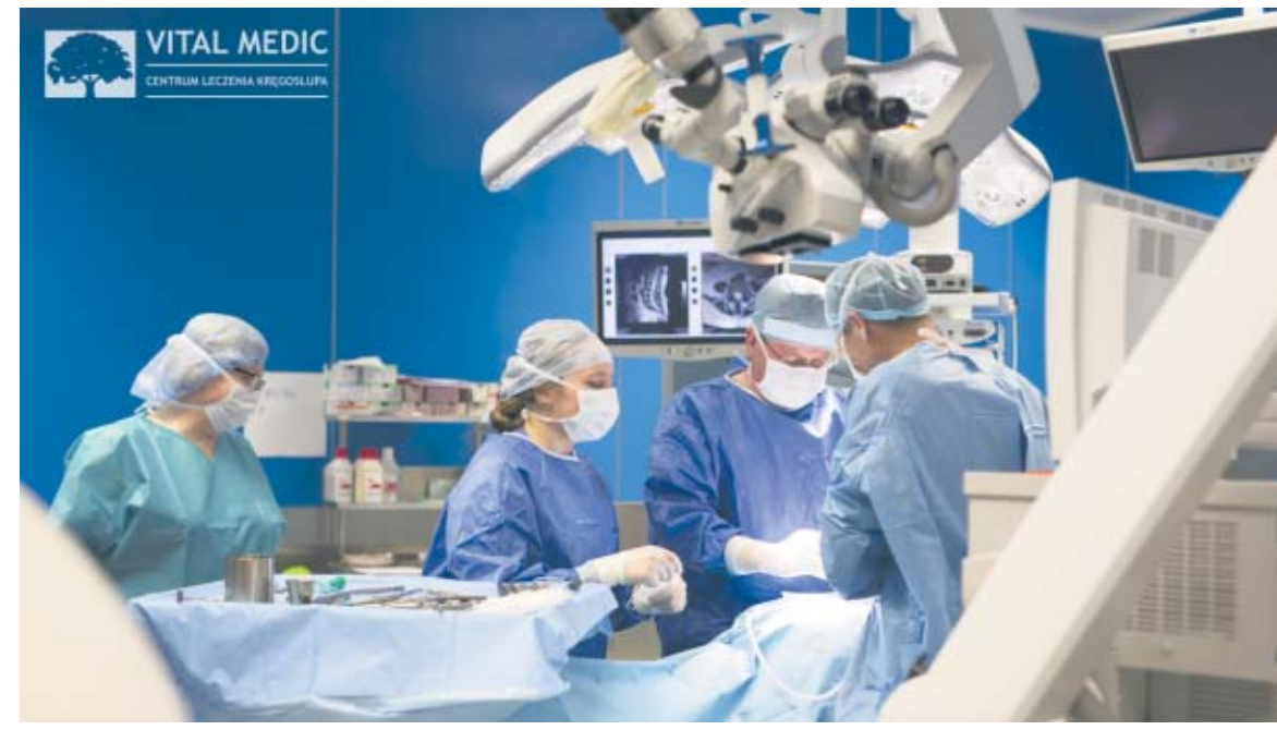
VITAL MEDIC CENTRUM LECZENIA KRĘGOSŁUPA