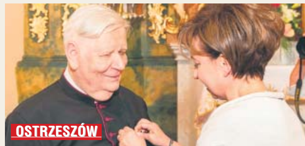
Wręczony Złoty Krzyż Zasługi jest uhonorowaniem dotychczasowej pracy ka-

staurowano szereg zabytkowych świątyń oraz odsłonięto na dziedzińcu kościoła farnego obelisk „Ofiarom Golgoty Wschodu”. Jest współorganizatorem uroczystości poświęconych rocznicom zbrodni katyńskiej, jak i napaści Związku Sowieckiego na Polskę.