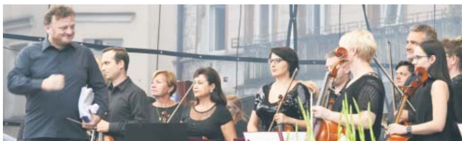
I znowu organizatorzy festiwalu udowodnili, że w niewielkim Kępnie można robić rzeczy wielkie. Brawo. RED