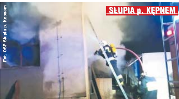
SŁUPIA p. KĘPNEM

W miniony poniedziałek około godz. 0.30 w Słupiu pod Kępnem wybuchł pożar budynku gospodarczego przylegającego do zakładu stolarskiego.