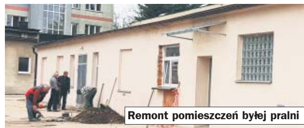
Remont pomieszczeń byłej pralni

Podczas spotkania (19 marca) prezes OCZ Marek Nowiński zapoznał radnych z najpilniejszymi zadaniami inwestycyjno-remontowymi, jakie stoją przed OCZ, wśród których znalazły się między innymi: remont pomieszczeń byłej pralni z przeznaczeniem na pomieszczenia