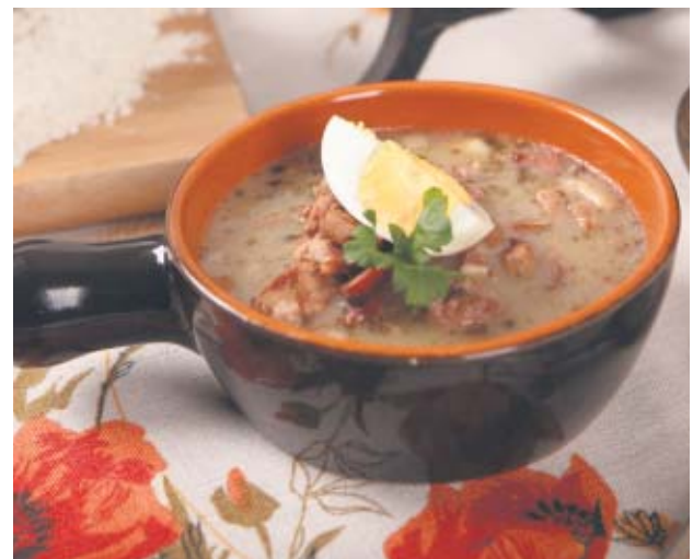
Żur na kielbasie