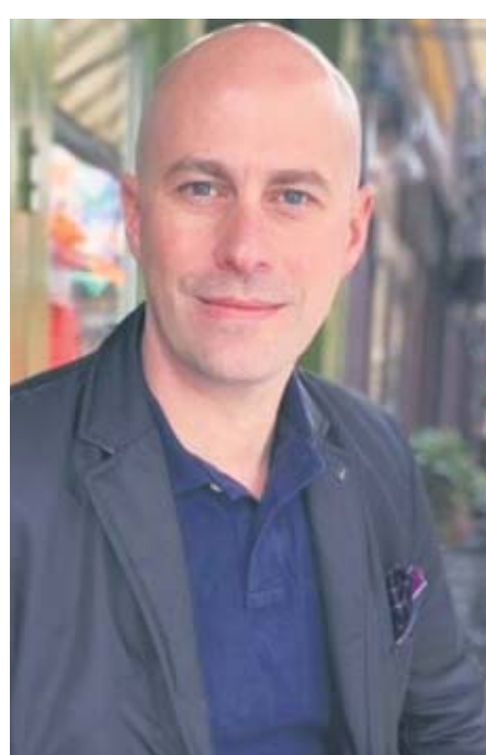
Europejski Koordynator Sieci Dziedzictwa Kulinarne Niclas Fjellström

Tradycja wyrabiania białej kielbasy w Wielkopolsce sięga XVII w. Obecnie, przy smak ten uzyskał unijny certyfikat i stał się, obok roga świętomarcińskiego czy smażonego sera, kulinarną wizytówką naszego regionu. Obok kielbasy na wielkanocnym stole powinien znaleźć się żur na zakwasie. Obecnie uznawany za wykwintną zupę dla sma-