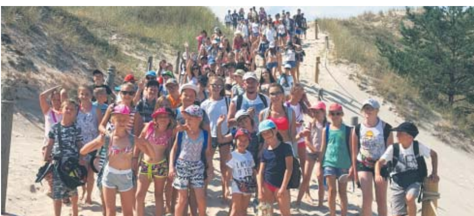
Tak bawili się dzieciaki na koloniach w ubiegłych latach