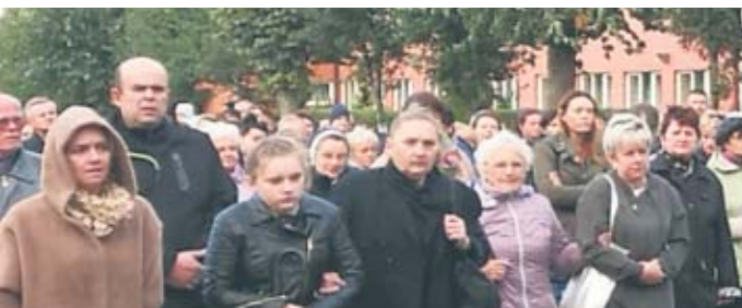
Figura świętego, która dotarła do Kraszewic w minioną środę, powitana została w centrum wsi przez parafian, po czym w procesji przeniesiona została do miejscowego kościoła,

Przez trzy dni trwała w kraszewickiej parafii peregrynacja kopii figury św. Michała Archanioła z Cudownej Groty Objawień na Górze Gargano.