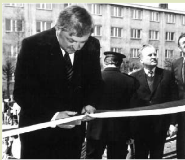
Prezes Zarządu Rejonowego Banku Spółdzielczego w Lututowie w dniu otwarcia nowej siedziby banku w 1988 r.

Wkrótce Pan Prezes tworzył (poprzez połączenie) kolejne Oddziały Banku Spółdzielczego w Lututowie - Oddziały w Braszewicach, Złoczewie, Klonowej, Kraszewicach, Czastarach