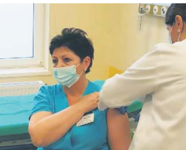
W środę 30 grudnia, niezwłocznie po otrzymaniu pierwszej partii szczepionek w Szpitalu w Kępnie rozpoczęły się szczepienia przeciw COVID-19.

- Niezwłocznie po otrzymaniu szczepionek rozpoczęli