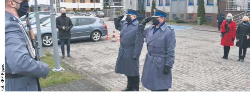
13 kwietnia pod pomnikiem pamięci funkcjonariuszy pomordowanych w sowieckich i hitlerowskich obozach zgłady, a służących na ziemi kępińskiej, złożono kwiaty i zapalono znicze. W ten sposób upamiętniono Dzień Pamięci Ofiar Zbrodni Katyńskiej.

W związku z panującą sytuacją epidemiologiczną uroczystość, jaka miała miejsce na dziedzińcu Komendy Powiatowej Policji odbyła się w bardzo małym gronie za-