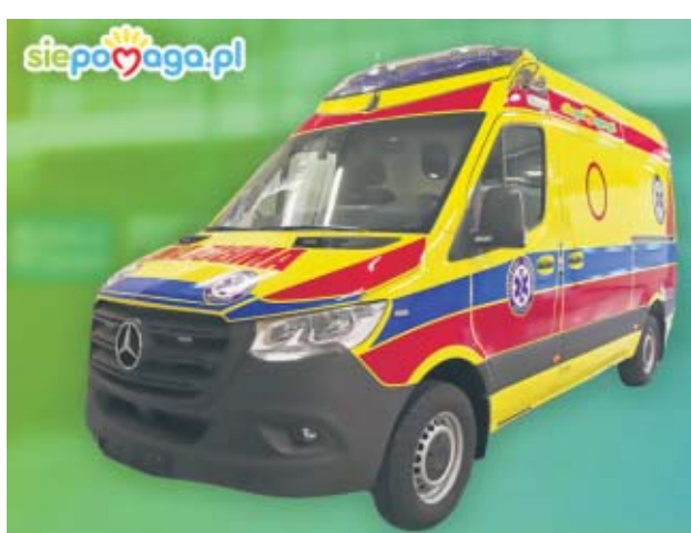
Zgodnie z zamówieniem złożonym przez Fundację Siepomaga u producenta, będzie to taki pojazd, jak na zdjęciu

Siepomaga.pl od blisko 10 lat skutecznie łączy ludzi chcących pomagać z potrzebującymi. Jest największą polską platformą charytatywną, która umożliwia osobom znajdującym się w trud-