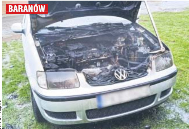
Kierowca pojazdu znajdował się na zewnątrz i nie wymagał pomocy medycznej.

W miniony czwartek (15 kwietnia) około godz. 16 dyżurny Stanowiska Kierowania Komendanta Powiatowego PSP Kępno otrzymał zgłoszenie o pożarze volkswagena przy ul. Jana Pawła II w Baranowie. Do zdarzenia zadysponowano zastępy z OSP Bralin, OSP Murator oraz JRG Kępno. - Po dotarciu na miejsce stwierdzono, że pali się komora silnika samochodu osobowego - mówi kpt. Paweł Michalski, rzecznik prasowy