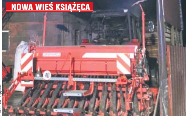
W Nowej Wsi Książęcej zapalił się stojący pod wiatą ciągnik rolniczy a obiekt przylegał do budynku gospodarstwa.

12 bm. około godz. 23 w Nowej Wsi Książęcej zapalił się stojący pod wiatą ciągnik rolniczy. Do zdarzenia zadysponowano zastępy z OSP Bralin, OSP Nowa Wieś Książęca, OSP Trębaczów, OSP Chojeńcin oraz JRG Kępno. - Po dotarciu na miejsce zdarzenia stwierdzono, że pod wiatą magazynową pali się ciągnik rolniczy - mówi kpt. Paweł Michalski, rzecznik prasowy KPP w Kępnie. - Osób poszkodowanych nie było, natomiast w są-