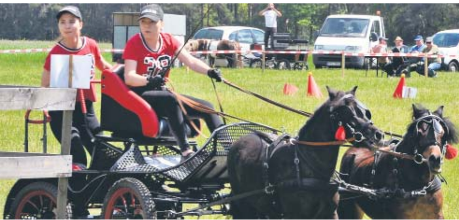
27 zaprzęgów stanęło na starcie II Zawodów Zaprzęgowych Poligon 2021, jakie odbyły się w pierwszą niedzielę czerwca w Kraszewicach.