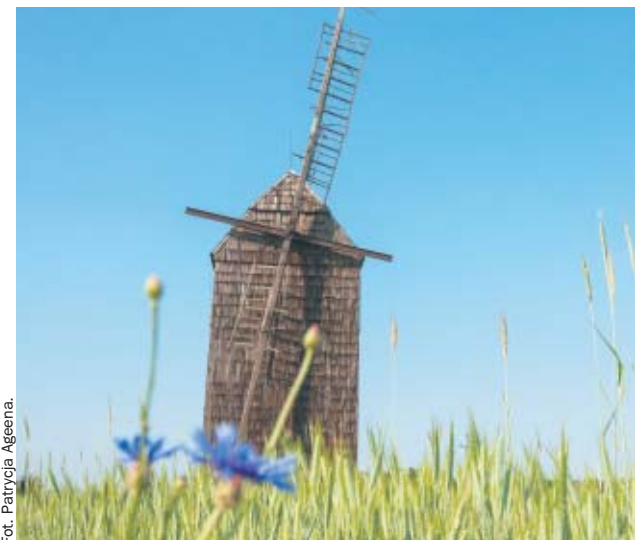
Stary wiatrak w Sikowie, w powiecie wolsztyńskim