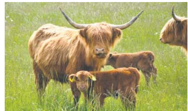
Dwór „Dębogóra” w Wieleniu w powiecie czarnkowsko-trzcianeckim