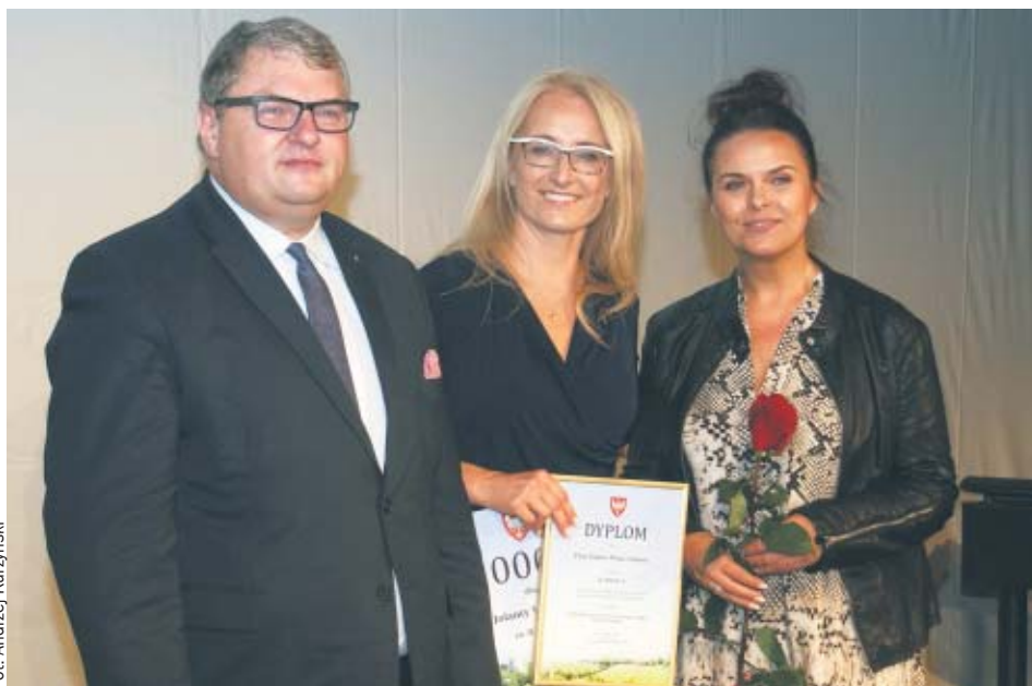
Gala Agroturystyki 2018

To wszystko sprawia, że w Wielkopolsce z roku na rok rośnie popularność agroturystyki, a odwiedzający coraz częściej wybierają wypoczynek w miejscu, które kojarzy się ze swoj-