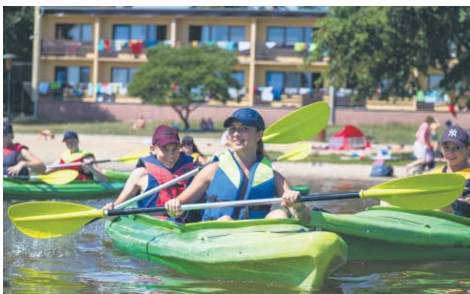
Ósrodek Wypoczynkowy „Krokus” w miejscowości Przemęt w powiecie wolsztyńskim

dróży sentymentalnej przez historię, smaki, zapachy, wspomnienia, spotkania z naturą i ciekawymi ludźmi. Mamy nadzieję,