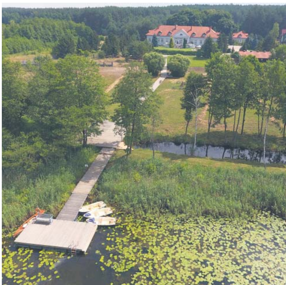
Agroturystyka „Weranda Home” w Sławicy w powiecie wągrowieckim