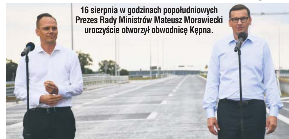
16 sierpnia w godzinach popołudniowych Prezes Rady Ministrów Mateusz Morawiecki uroczystie otworzył obwodnicę Kępna.

Mateusz Morawiecki podkreślał, jak ważna jest budowa całego odcinka S11. - Bardzo się cieszę, że w nowym Programie Budowy Dróg Krajowych, który opiera się na blisko 300 miliardów złotych, mamy środki na skompletowanie wszystkich odcinków tej drogi - podkreślał premier. Droga S11 od Kołobrzegu przez Koszalin, Bobolice, Szczecinek i potem w Wielkopolsce Piła, Chodzież, Oborniki Wielkopolskie, Poznań i dalej na południe Jarocin, Pleszew, Ostrów Wielkopolski, Ostrzeszów, Kępno i przez Opole aż do Tarnowskich Gór i Pyrzowic, to niezwykle potrzebna droga, dzięki której ta południowa część Wielkopolski, na styku z Opolszczyzną, niedaleko Dolnego Śląska, województwa łódzkiego będzie miała znakomite położenie transportowe. Każdy kilometr tej drogi to kilometr nowych możliwości, to nowe możliwości przyciągnięcia przedsiębiorców, którzy tworzą miejsca pracy - dowodził. Wtórował mu