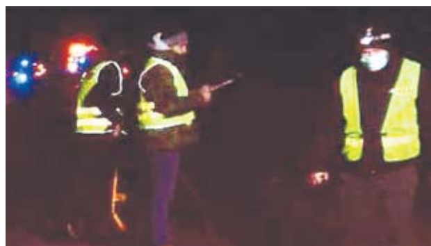
- Kierujący renault 48-letni mieszkaniec powiatu ostrowskiego najechał na leżącego na jezdni 49-let-

Do tragicznego w skutkach zdarzenia doszło w miniony piątek (29 stycznia) około godz. 18 w terenie zabudowanym, na prostym odcinku nieoświetlonej drogi krajowej K-25 w miejscowości Kotowskie.