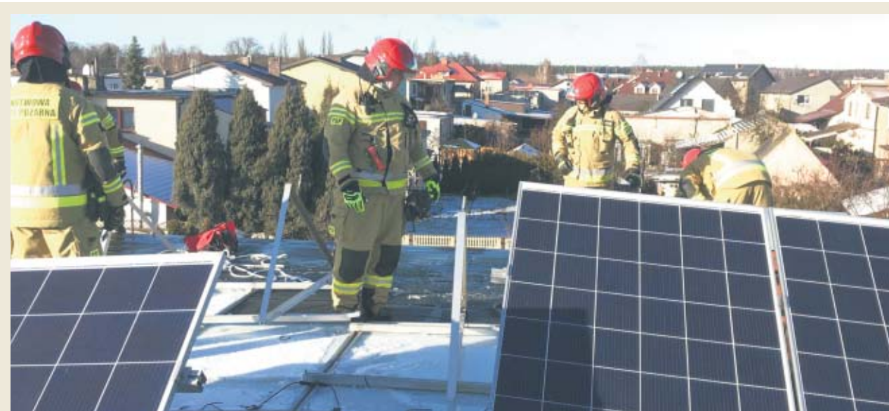
Strażacy usuwali skutki gwałtownych zjawisk atmosferycznych