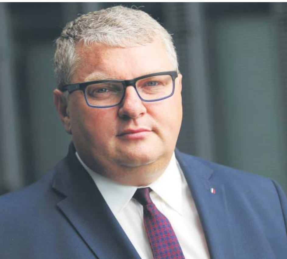
Inicjator akcji Wspieraj Wielkopolskich Producentów - Krzysztof Grabowski - Wicemarszałek Województwa Wielkopolskiego