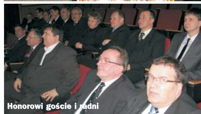
Honorowi goście i radni