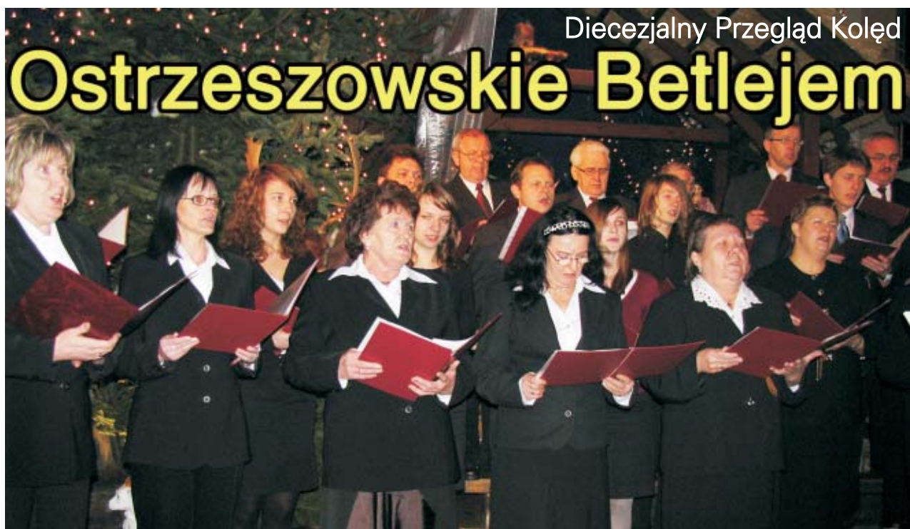
Diecezjalny Przegląd Kołęd

ziony do kluczborskiego szpitala. Jego o rok starszy kolega (mieszkaniec Ostrowa Wlkp.) mimo przeprowadzonej reanimacji zmarł. - Wiemy, że kierowca scani był trzeźwy, resztę wyjaśni postępowanie prowadzone przez Prokuraturę Rejonową w Kluczborku oraz Państwową Inspekcję Pracy w Opolu - dodaje Czekaj. MON