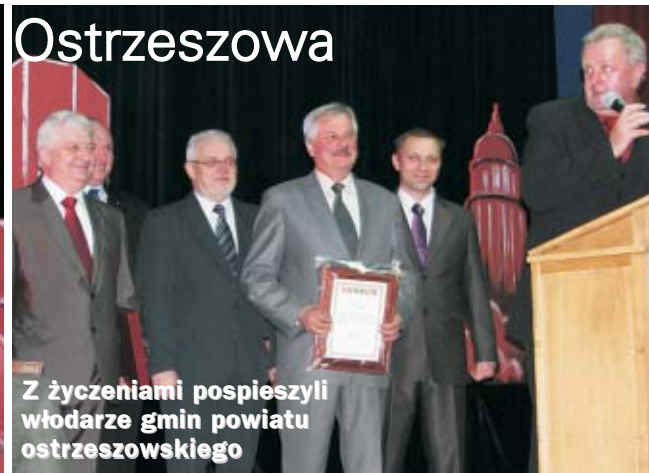
Z życzeniami pospieszyli wódcze gmin powiatu ostrzeszowskiego