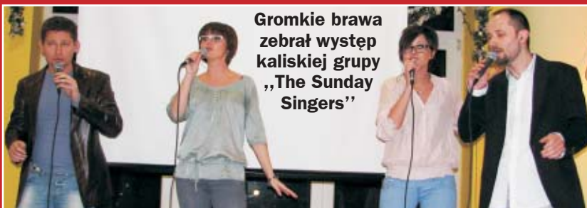
Gromkie brawa zebrał występ kaliskiej grupy „The Sunday Singers”