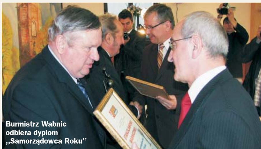
Burmistrz Wabnic odbiera dyplom „Samorządowca Roku”