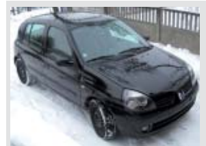
Renault Clio 2004 r., 1,5 dci, 5-drzwiowy, klimatronic, elektrycznie szyby i lusterka, stan bdb, cena 15.000 zł. Tel. 605 909 038