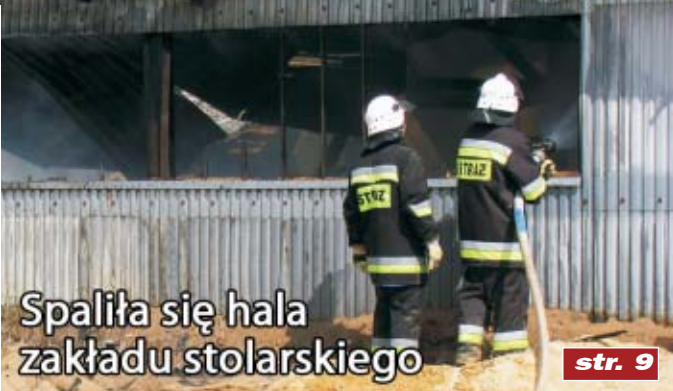
Spaliła się hala zakładu stolarskiego

wtorek 1 czerwca 2010 r. cena 1.90 zł. (w tym 7% VAT) nr 22 (404) ISSN 1644-0498 INDEKS 372188 e-mail: twojpuls@data.pl www.pulstygodnia.pl