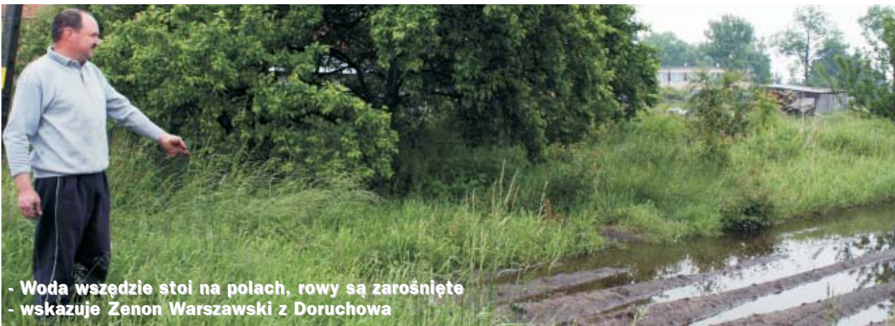
- Woda wszędzie stoi na polach, rowy są zarośnięte - wskazuje Zenon Warszawski z Doruchowa

Zamiast zawczasu zadbać o stan Prozny, rowów i cieków urzędnicy woleli stać z założonymi rękami tłumacząc się brakiem pieniędzy. Skutki powodzi są przerażające - wciąż trwa liczenie strat.