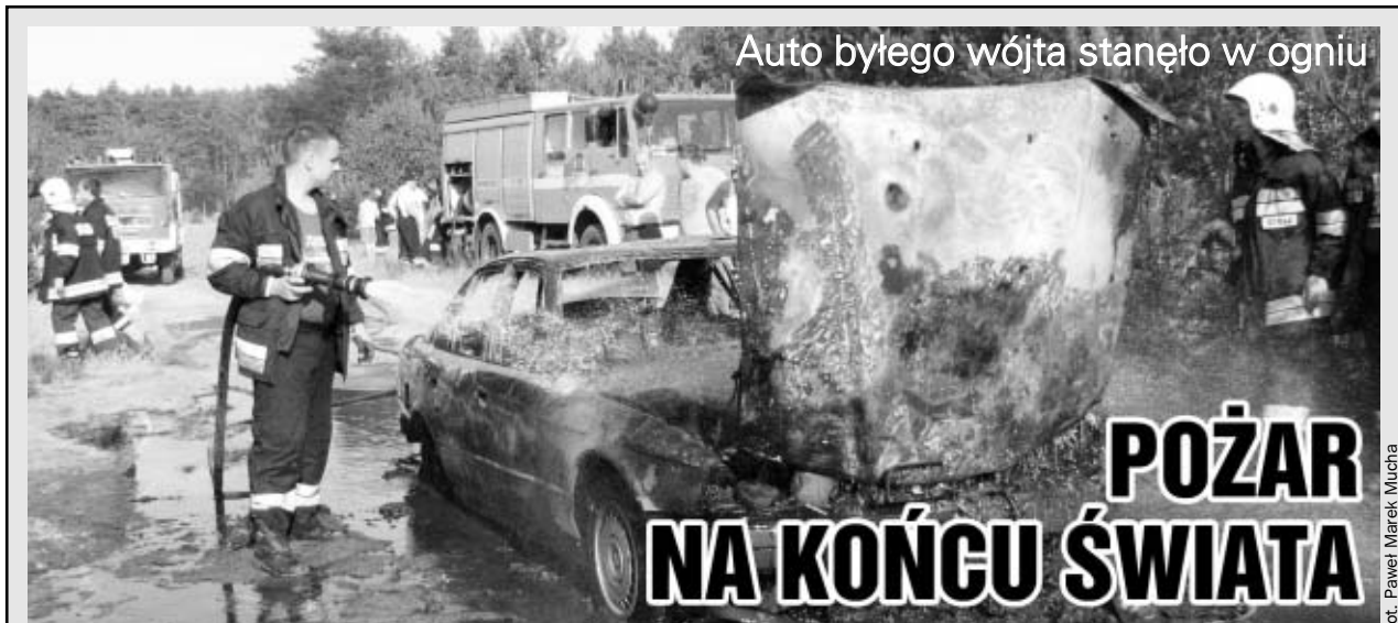
Auto byłego wójta stało w ogniu