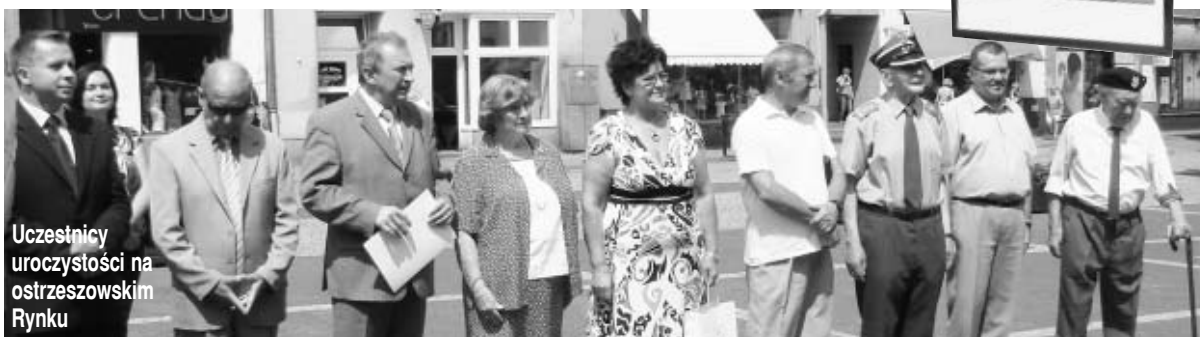
Uczestnicy uroczystości na ostrzeszowskim Rynku