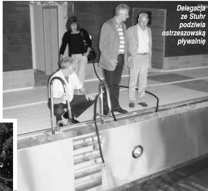
Delegacja ze Stuhr podziwia ostrzeszowską pływalnię