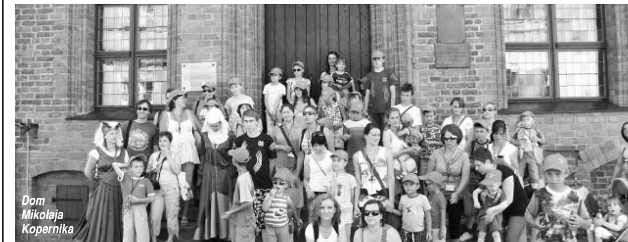
Dom Mikołaja Kopernika

Burmistrz Miasta i Gminy Ostrzeszów informuje, że na tablicy ogłoszeń w Urzędzie Miasta i Gminy Ostrzeszów, ul. Zamkowa 31 wywieszony został,