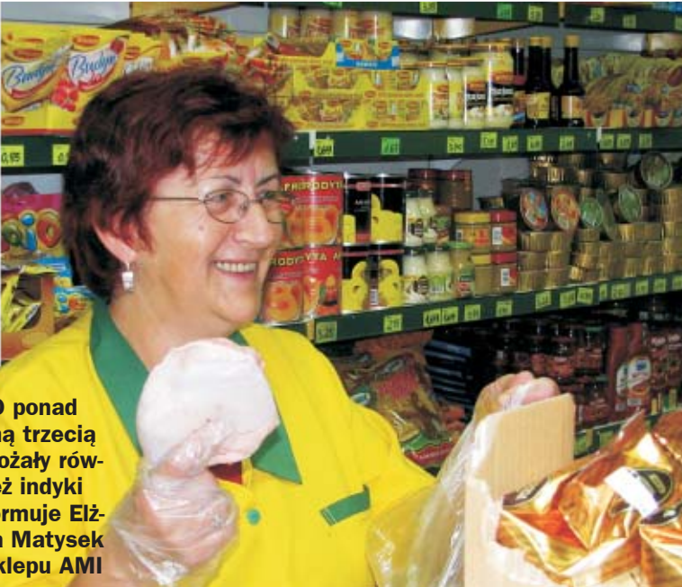
- O ponad jedną trzecią podrożały również indyki - informuje Elżbieta Matysek ze sklepu AMI