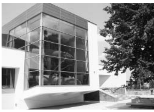
Budynek krytej pływalni od frontu

Uczestnicy delegacji mogli podziwiać postępy w pracach budowlanych, a właściwie wykończeniowych. Najbardziej znaczące okazało się częściowe napełnienie nieckii pływalni wodą! Dla wszystkich amatorów wodnych szaleństw zamieszczamy aktualne zdjęcia pływalni.