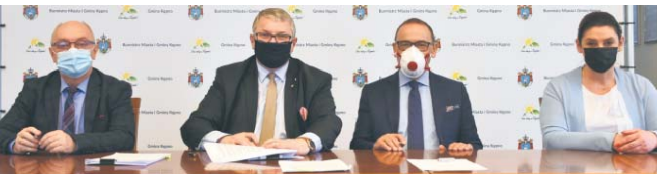
KĘPNO Na adaptację budynku, doposażenie i plac zabaw