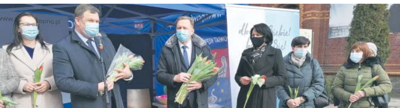
KĘPNO Kwiatek i zaproszenie na mammografię

8 marca na Skwerze Pocztowym w Kępnie odbył się happening, w czasie którego m.in. zachęciano kobiety do bezpłatnej mammografii. Były też oczywiście tulipany dla pań, bo to przecież Dzień Kobiet.