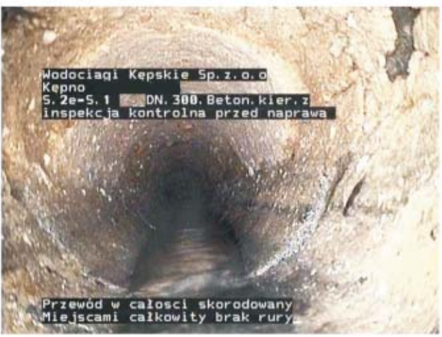
Wodociągi Kępskie Sp. z o.o. Kępno S. 2e-5. 1 DN. 300. Beton. kier. z inspekcja kontrolna przed naprawą