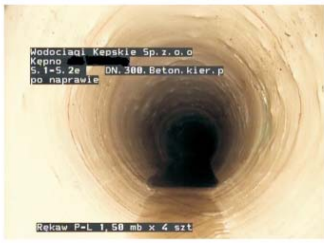
Wodociągi Kępskie Sp. z o.o. Kępno S. 1-5. 2e DN. 300. Beton. kier. p po naprawie