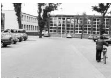
Parking przy budynku Kinoteatru PIAST