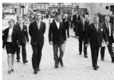
Wizyta premiera Norwegii