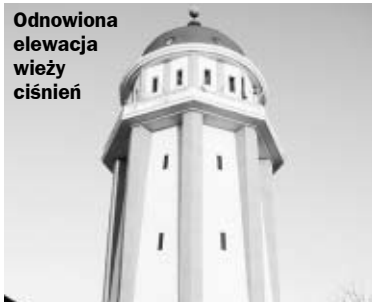
Odnowiona elewacja wieży ciśnień