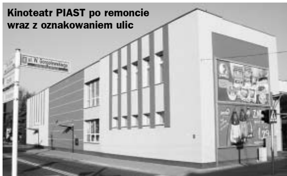
Kinoteatr PIAST po remoncie wraz z oznakowaniem ulic

12 listopada br. zakończyła się V kadencja samorządu Miasta i Gminy Ostrzeszów. Nadszedł więc czas podsumowań dokonań minionych czterech lat. Był to czas dobrze wykorzystany i obfitował w wiele ważnych przedsięwzięć, które w skrócie przedstawiamy poniżej: