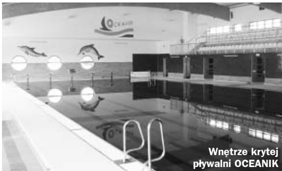
Wnętrze krytej pływalni OCEANIK