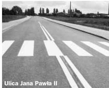
Ulica Jana Pawła II