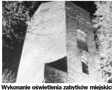
Wykonanie oświetlenia zabytków miejskich