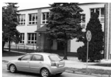
Remont Biblioteki Publicznej im. St. Czernika