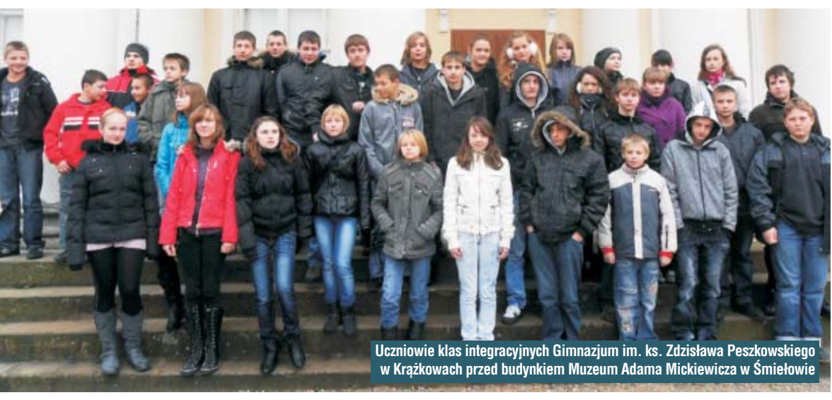
Uczniowie klas integracyjnych Gimnazjum im. ks. Zdzisława Peszkowskiego w Krążkowach przed budynkiem Muzeum Adama Mickiewicza w Śmielowie

.....Dzieci mają prawo do szczególnej troski i pomocy [...] we wszystkich działaniach dotyczących dzieci podejmowanych przez publiczne lub prywatne instytucje opieki społecznej, sądy, władze administracyjne lub ciała ustawodawcze. Sprawą nadrzędną będzie najlepsze zabezpieczenie interesów dziecka".