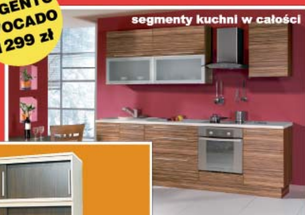
segmenty kuchni w całości