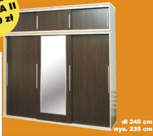
dł. 240 cm wys. 235 cm