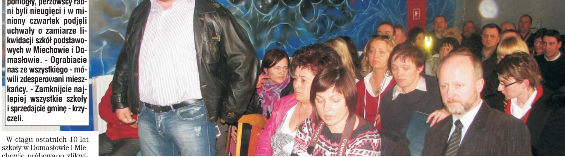
Protesty, krzyki i listy nie pomogły, perzowscy radni byli nieugięci i w miniony czwartek podjęli uchwały o zamiarze likwidacji szkół podstawowych w Miechowie i Domasłowie. - Ograbiacie nas ze wszystkiego - mówili zdesperowani mieszkańcy. - Zamknijcie najlepiej wszystkie szkoły i sprzedajcie gminę - krzyczeli.

Radni podjęli uchwały intencyjne o zamiarze likwidacji szkół podstawowych w Miechowie i Domasłowie