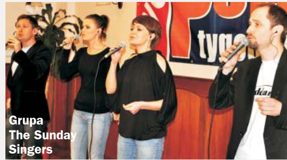
Grupa The Sunday Singers